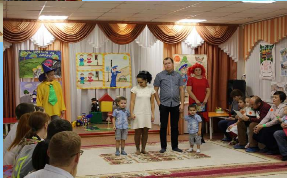
Семейный форум «За безопасность всей семьей»