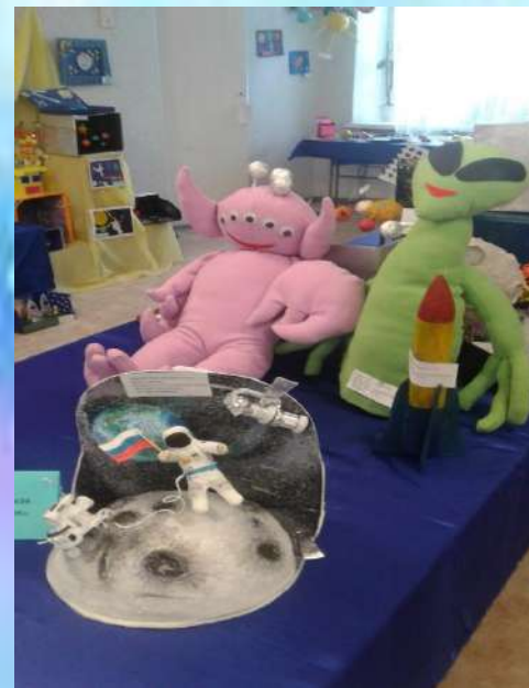
Космос – это мы.