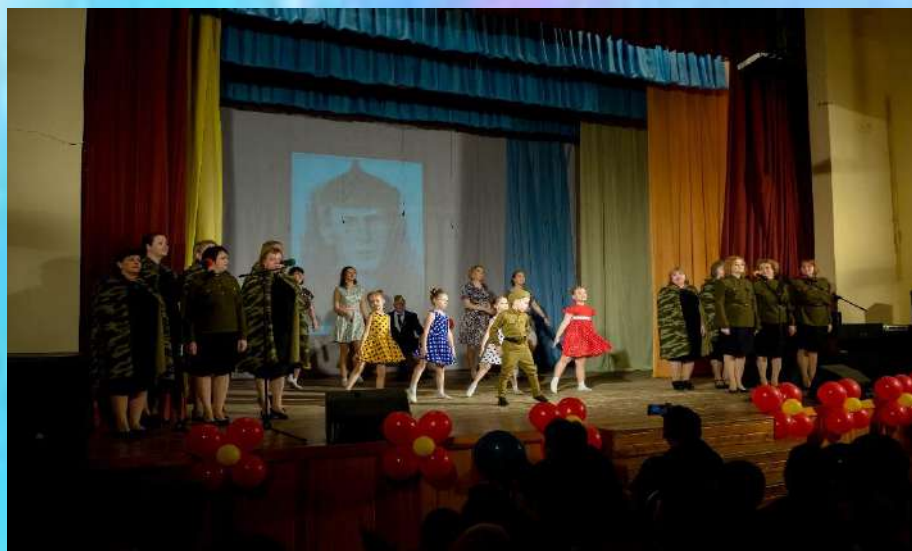
Поющий детский сад