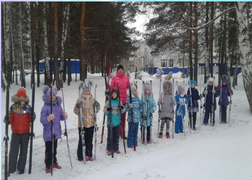
Занятия на лыжах