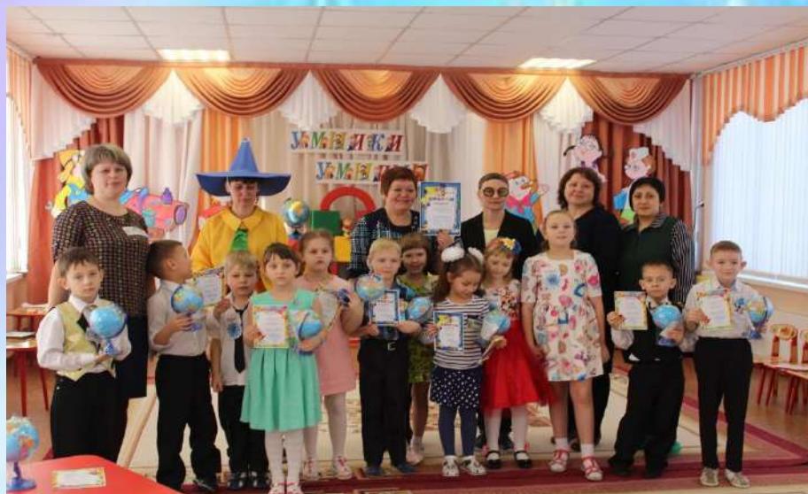
Умники и умницы