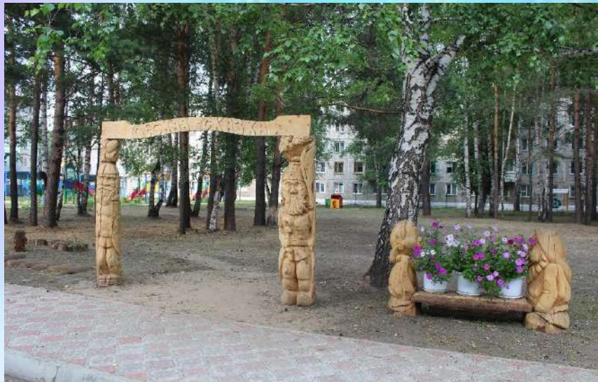
Вход на Экологическую тропу