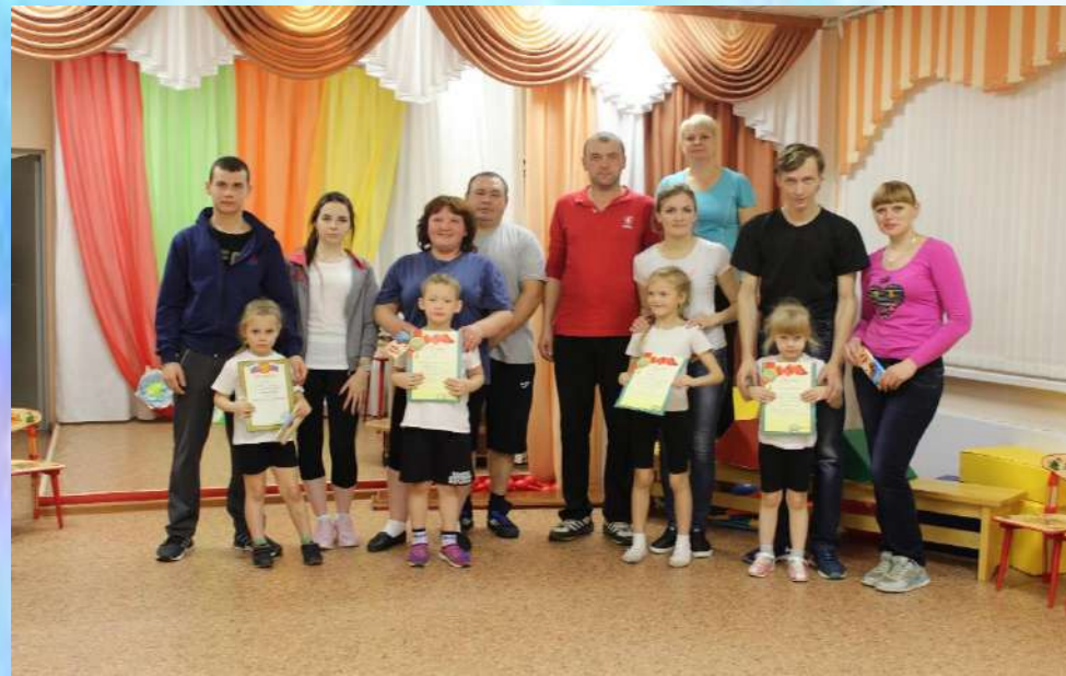
Совместные с родителями спортивные праздники