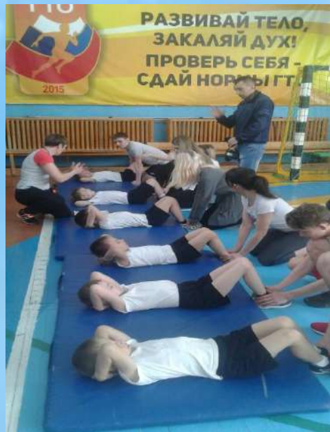
Сдача норм ГТО