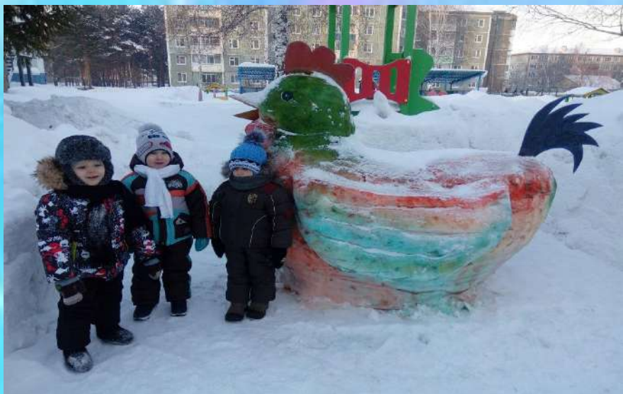
Зимняя планета детства