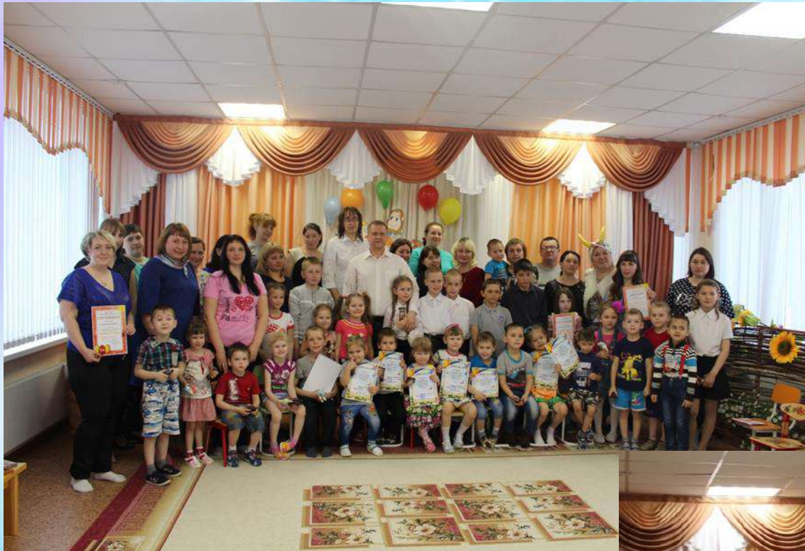
Семейный форум «Хорошо на белом свете»