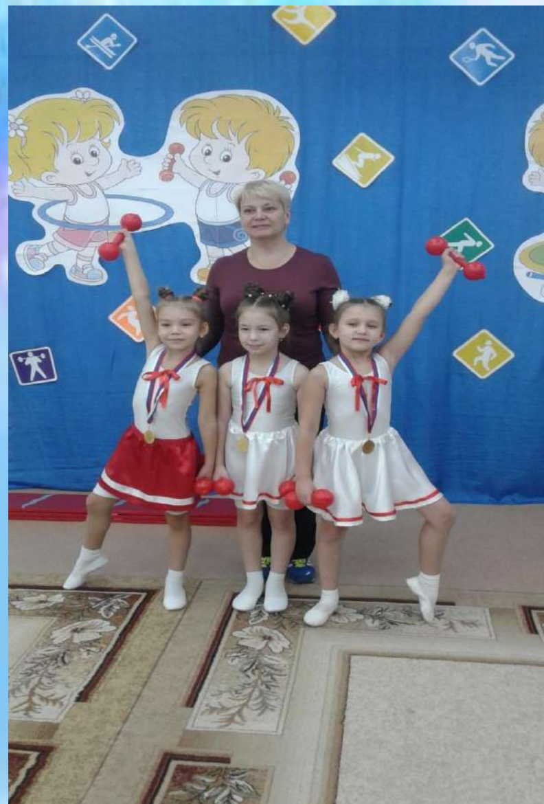
Физкульт – Ура!